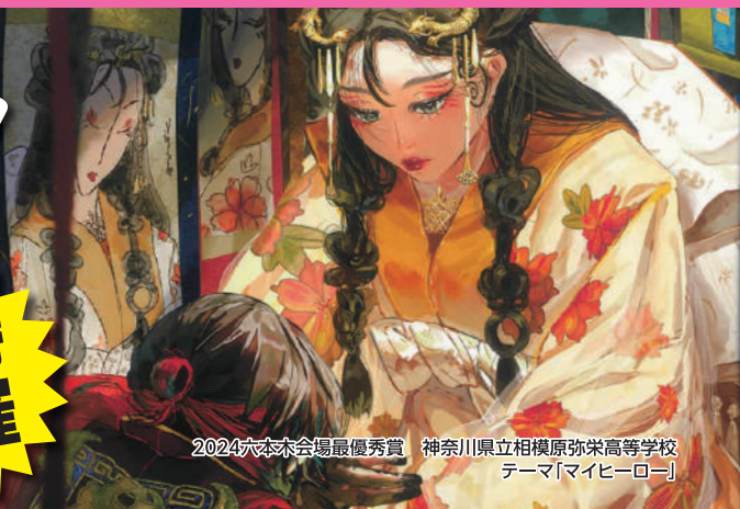
2024六本木会場最優秀賞 神奈川県立相模原弥栄高等学校 テーマ「マイヒーロー」